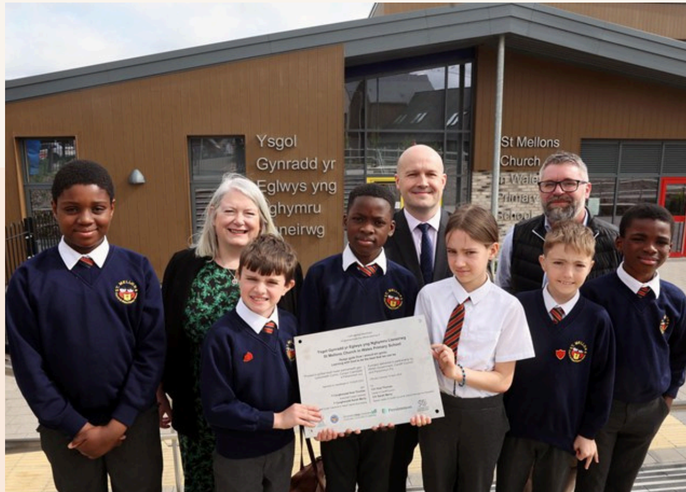
Adeilad ysgol newydd a gyflenwyd gan Persimmon yn Llanedeyrn

Mae adeiladwyr cartrefi hefyd yn cefnogi cymunedau lleol tu hwnt i rwymedigaethau cynllunio, yn cynnwys drwy gyfraniadau elusennol, staff yn gwirfoddoli a chynlluniau hybu natur tebyg i lwybrau draenogod a manau tyfu cymunedol.