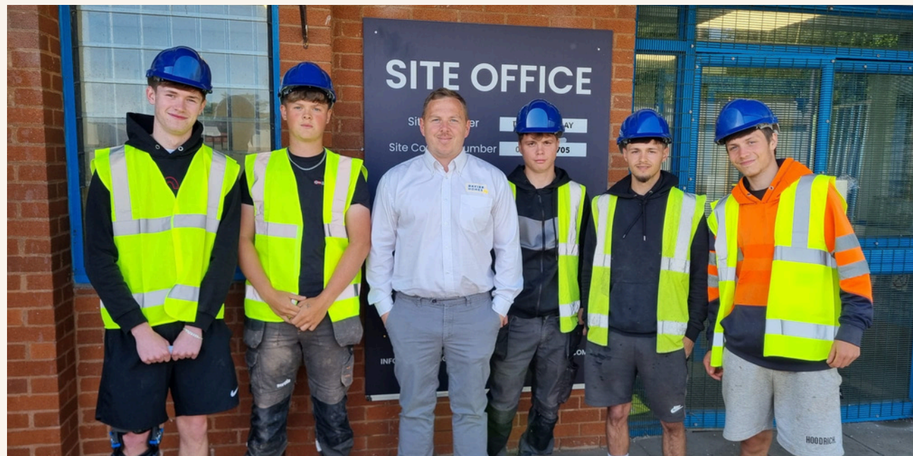
Prentisiaid Davies Homes, busnes bach a chanolig yn Ne Cymru